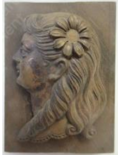
No.10 砲金製マスター 少女 (陽)