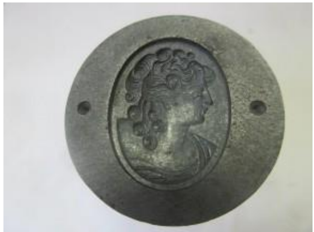
No.2 Z A S 製転写品 女性像 (陰)