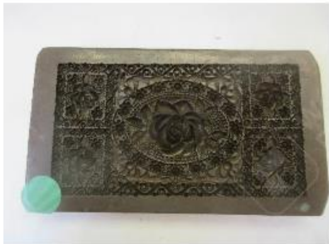
No. 15 砲金製圧搾成形用金型 ばら文角板 (陰)