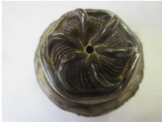
No.9 砲金製マスター 六角紋 (陽)