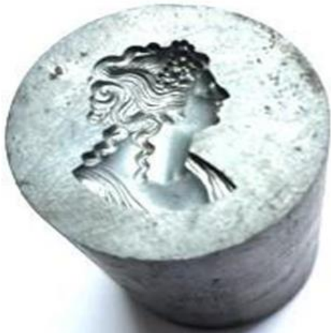
No.1 Z A S 転写品 女性像 (陰)