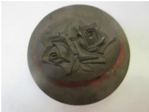
No.7 砲金製マスター ばら (陽)