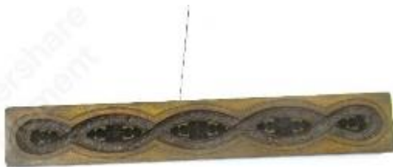
No. 16 砲金製圧搾成形用金型 カチューシャ (陰)