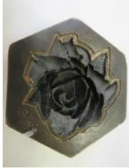
No.8 砲金製圧搾成形用金型 ばら (陰)