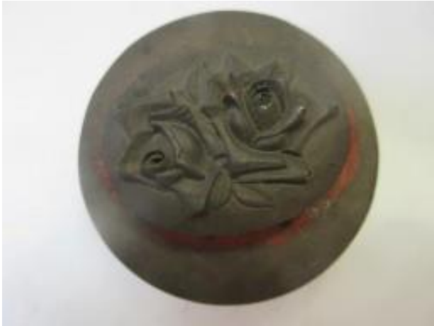
No.7 砲金製マスター ばら (陽)