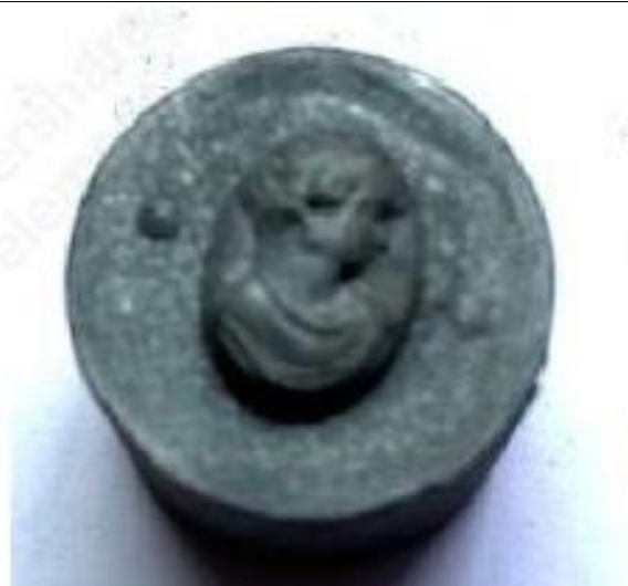
No.4 Z A S 製転写品 女性像 (陽)