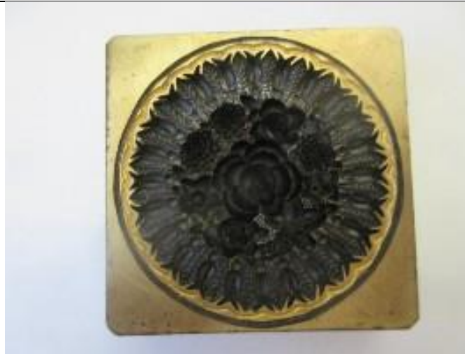
No.11 砲金製圧搾成形用金型 円花束 (陰)