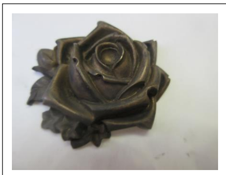
図 3 マスター