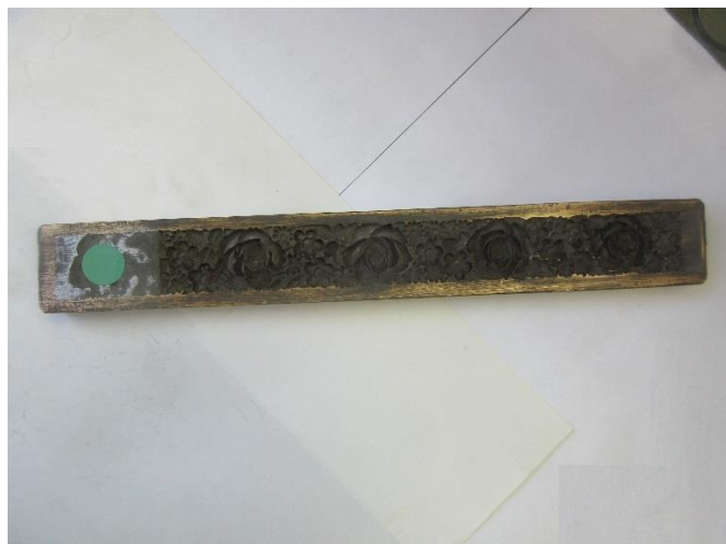
No.17 砲金製圧搾成形用金型 腕輪 (陰)