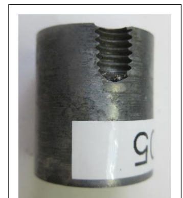
図 6 入れ駒取付用メネジ

鋼製のモールドベースにキャビティ部として取り付けられた。今回の例で裏側に固定用のネジ（M6 メネジ）が切られている（図 6）。