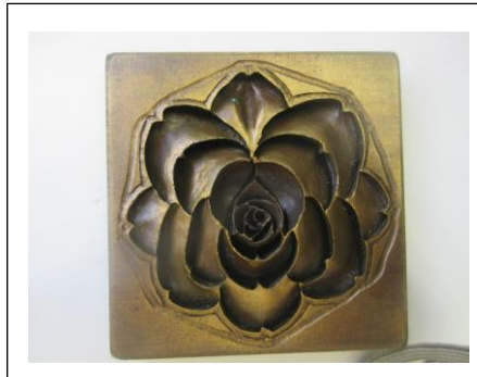
図 1 圧搾成形用金型