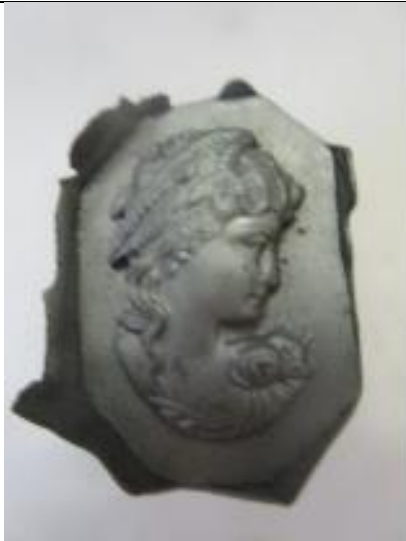
No.3 Z A S 製転写品 女性像 (陽)