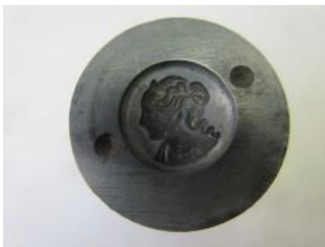
No.5 Z A S 入れ駒 女性像 (陰)