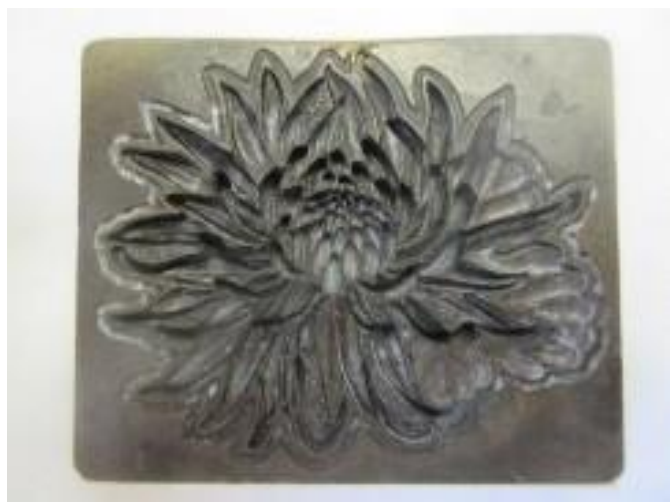
No.13 砲金製圧搾成形用金型 きく (陰)