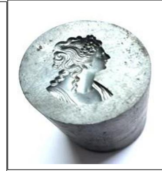
図 2 ZAS 製金型用入れ駒