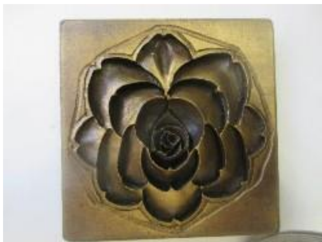
No.14 砲金製圧搾成形用金型 ばら (陰)