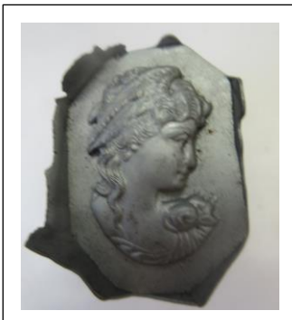
図 4 ZAS 転写品（陽）