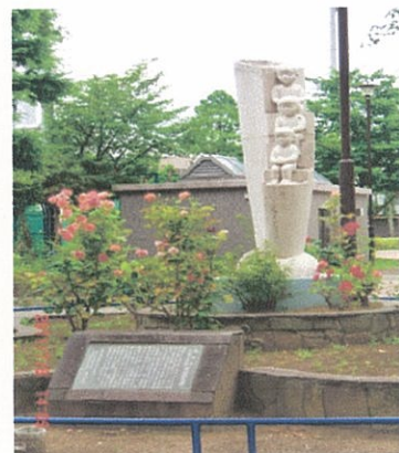
葛飾セルロイド工場発祥記念碑 (東京都葛飾区澁江公園)