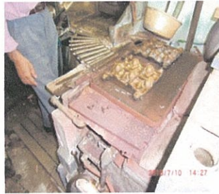
2、上下の金型を温める