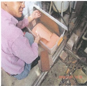
1、裁断したセルロイド