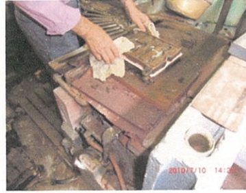
3、セルロイドを金型に挿む