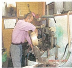
4、ザーザーと水をかける